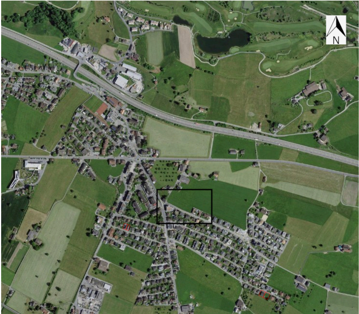
Übersicht über die Gemeinde Wangen. Der Foto-Ausschnitt auf Seite 1 ist schwarz markiert.